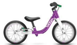
1 12" · 2,95 kg · 1,5–3,5 roku

Děláme superlehká a dostupná kola pro děti ve věku od roku a půl do čtrnácti let. Každý detail na našich modelech je důsledně promyšlený a navržený s důrazem na anatomii dětského těla. Více zábavy a bezpečí při objevných výpravách na dvou kolech!