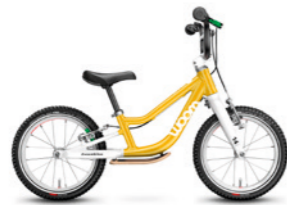
1 PLUS 14" · 4,2 kg · 3–4,5 roku