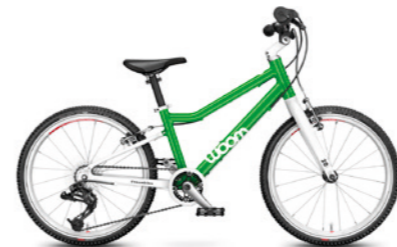
4 20" · 7,7 kg · 6–8 let