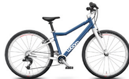
5 24" · 8,7 kg · 7–11 let