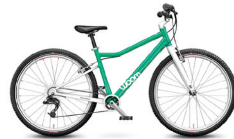
6 26" · 9,5 kg · 10–14 let