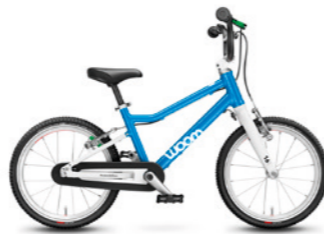
3 16" · 5,4 kg · 4–6 let