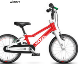
2 14" · 5 kg · 3–4,5 roku